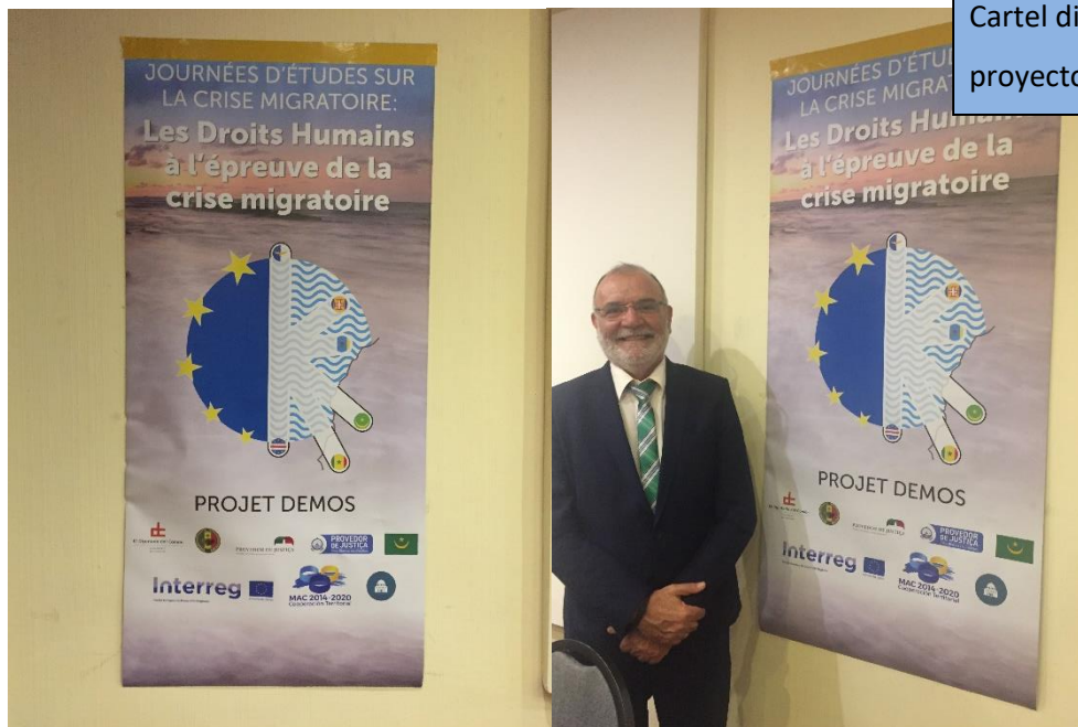
Cartel divulgativo del proyecto DEMOS

Se diseñaron, maquetaron e imprimieron los programas para las jornadas de migraciones. Además, se diseñó e imprimió un cartel divulgativo del proyecto que se colocó en la sala durante las jornadas. También, se imprimieron los carteles con los nombres de los socios, ponentes y expertos que participaron en el evento.