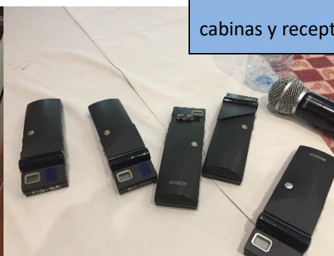
Material de sonido, cabinas y receptores