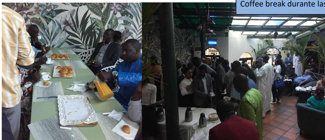
Coffee break durante las jornadas de migraciones