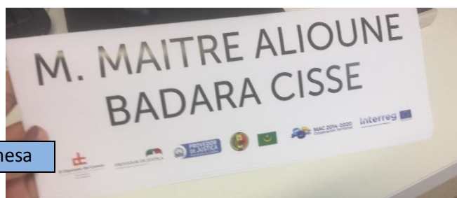
Carteles de mesa