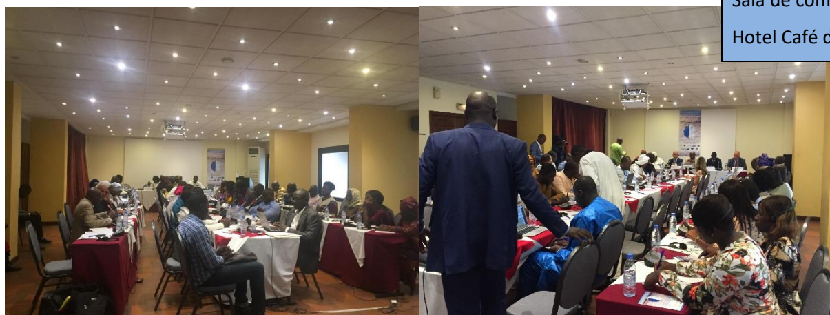
Sala de conferencias del Hotel Café de Rome

Se contactó con el Hotel Café de Rome para alquilar la sala de conferencias para 80 personas, contratar los servicios de coffee break y el almuerzo para los asistentes durante los dos días que duraban las jornadas.