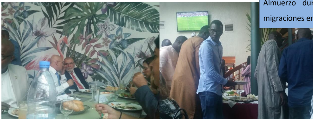
Almuerzo durante las jornadas de migraciones en el Hotel Café de Rome